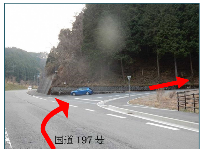
須崎方面から見た交差点