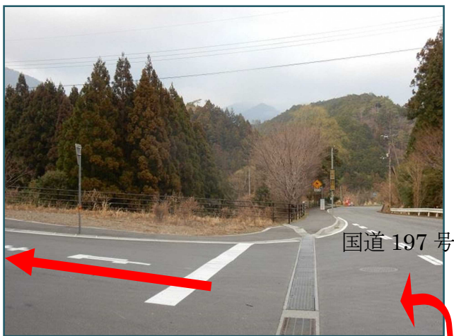
梶原方面から見た交差点